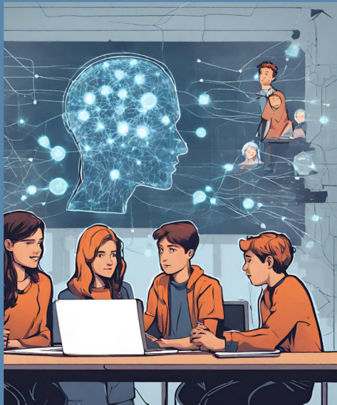
Bildquelle: CANVA Text zu Bild KI